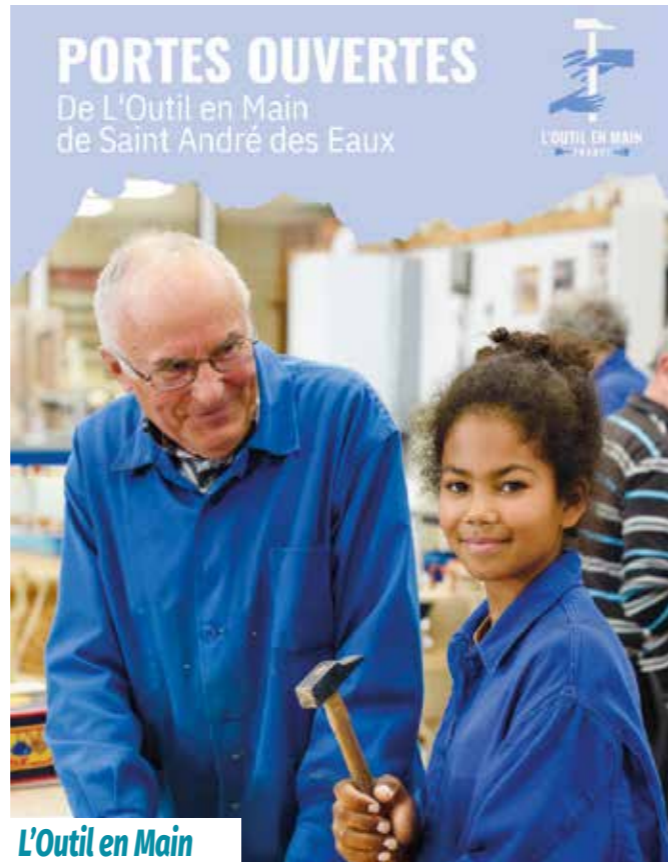
L'Outil en Main

Contact : chalandsfleuris44117@gmail.com